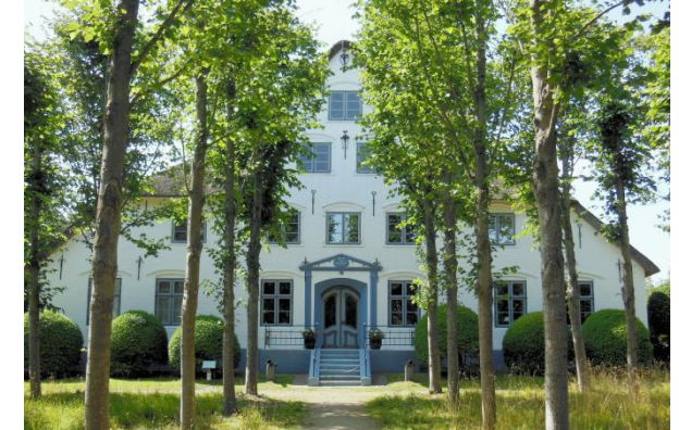
Das Entwicklungs- und Pflegekonzept ist die Leitlinie für die Erhaltung des Hochdorfer-Garten

Das neue Buch „Haubarg-Gärten als Kulturgut würdigen und erhalten“ geht vor allem der Frage nach, unter welchen kulturhistorischen und ökologischen Gesichtspunkten diese Gärten für die Zukunft gepflegt und erhalten bleiben können.