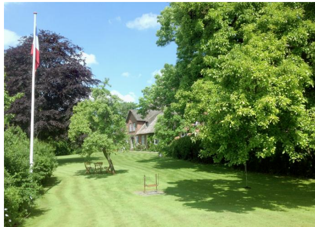
Der markante alte Baumbestand ist durch die Klimaveränderung besonders gefährdet.

„Meine Erkenntnis aus diesem Buch: ich dachte immer, dass die Engländer die größten Perfektionisten bezüglich Cottage und Landgärten/ Bauerngärten sind, aber das stimmt nicht so ganz, wenn man die Bilder der Haubarge sieht. Hier trifft Tradition und Geschichte sowie Respekt für Denkmäler aufeinander und ich bewundere jeden Besitzer dieser Häuser, mit welcher Kraft und Energie sie diese Häuser und Gartenanlagen pflegen. Dank Halke Lorenzen war dies ein besonderer Einblick in die verborgene Welt Eiderstedts“.