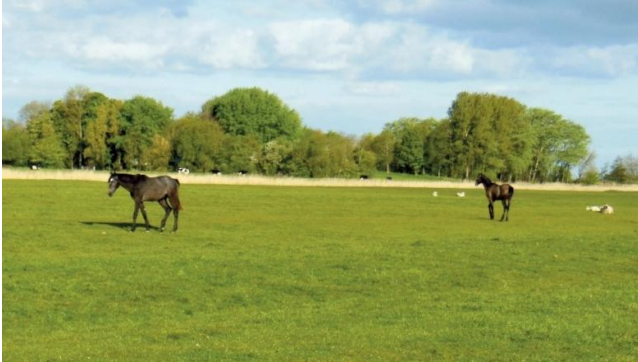
Hinter dieser baumbestandenen Insel muss der Staatshof stehen. Der Haubarg-Garten befindet sich im „Dornröschenschlaf“.

Mit dem Buch „Bauerngärten der Eiderstedter Haubarge – Das Geheimnis hinter den Bäumen“ ist zum ersten Mal in größerem Umfang das Geheimnis hinter mancher baumbestandenen Insel der Eiderstedter Marsch gelüftet worden.