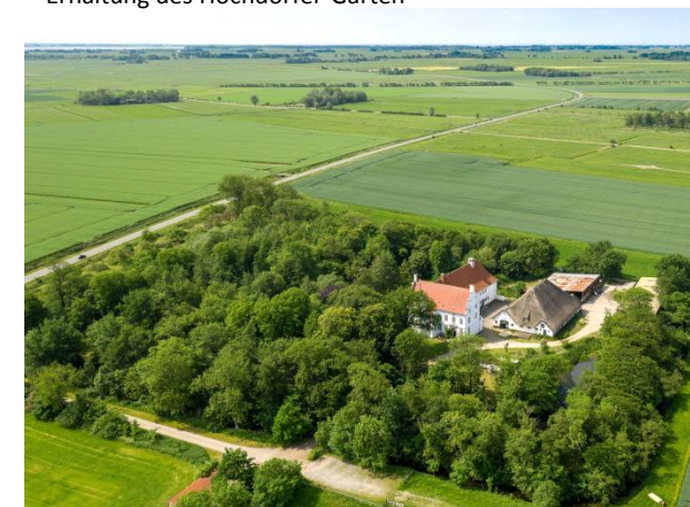
Hoyerswort: Ein mit Graften durchzogener Baumgarten. Wie kann die Zukunft dieser parkartigen Anlage aussehen?