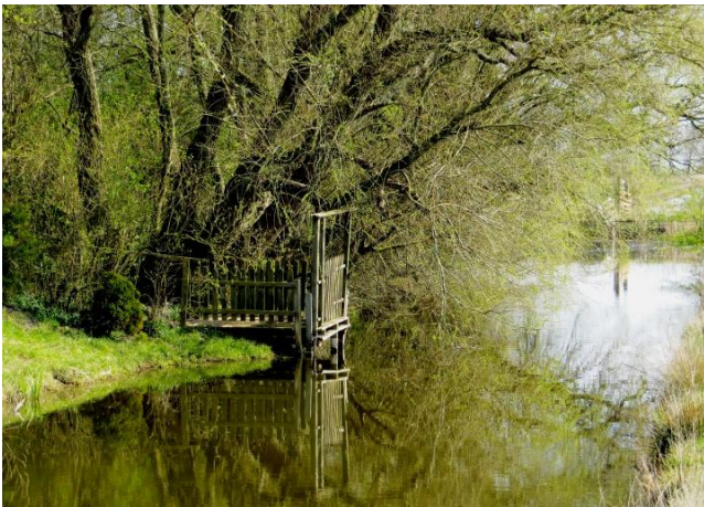
Gartenhistorischen Elemente sind erhaltenswert, schützwürdig und förderfähig.